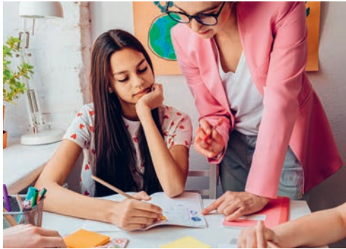
Die Hausaufgabenbetreuung der Primarschule wird per Februar 2026 eingestellt.

Unter dem Stichwort Chancengerechtigkeit wurde im «Aktionsplan II: Kinderfreundliche