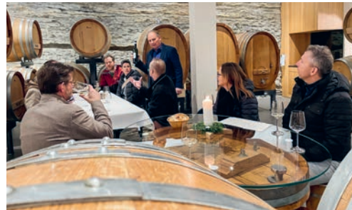
Der Gemeinderat und seine Partnerinnen und Partner lernten das Weingut Herzog besser kennen.