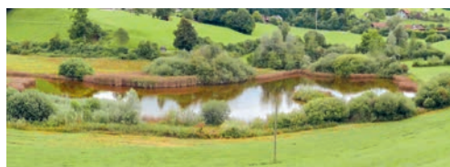
Girenmoos: Ufer mit starker Verbuschung.